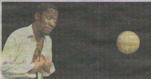
■ « Cahier d'un retour au pays natal »

À l'occasion du centenaire de la naissance d'Aimé Césaire, la compagnie Persona dirigée par Renaud Lescuyer, met en scène son premier ouvrage « Cahier d'un retour au pays natal ». Composée entre 1936 et 1939, c'est une œuvre conçue comme un long poème qui affirme déjà l'un des thèmes majeurs de Césaire, celui de l'égalité de tous les hommes. Avec une langue incisive, il défend l'universalité des droits fondamentaux, sa foi en la nature humaine qui firent de lui un