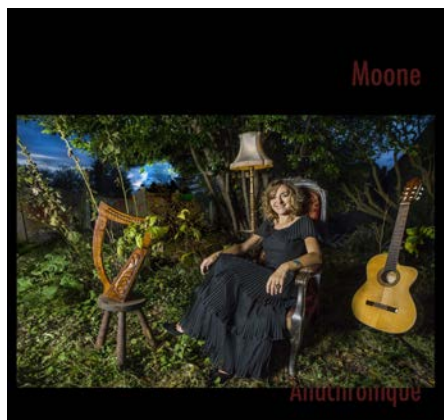
EP - Anachronique